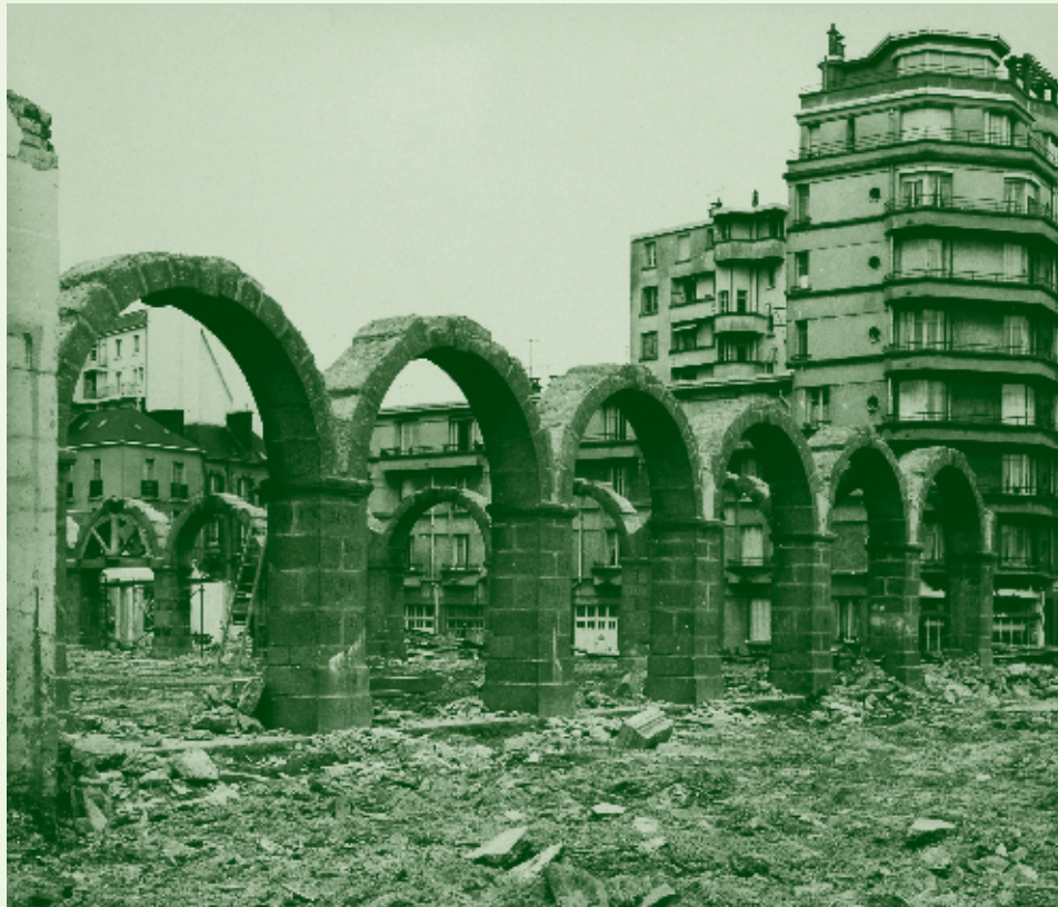
Rennes destruction de la caserne du colombier, Charles Barmay, 1966, Rennes.

Dans les années 50, le quartier Colombier connaît sous l'initiative du maire de l'époque, Henri Fréville, une urbanisation sans précédent. Dans une pensée moderniste, une ville nouvelle sort de terre en quelques années faisant table rase du passé. Du Colombier historique ne reste quasiment rien. Entre le quartier moderne et le pont SNCF de la rue de Nantes, subsiste l'ancien quartier avec ses maisons bourgeoises et ailleurs, disséminés dans la ville, des éléments patrimoniaux, dispersés... Qui sait où ? Retour sur ce patrimoine confisqué par l'Histoire.