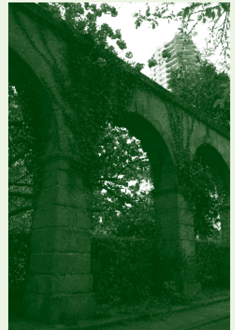
Arcades installées Square Guy Houist / Bourg L'Évêque