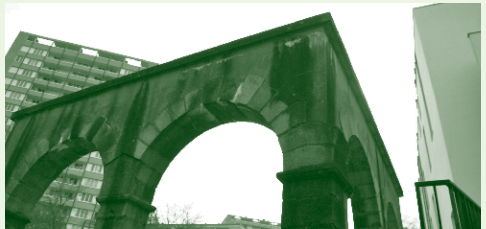
Arcades installées au Gros-Chêne/ Maurepas

Un tour de vélo, un ticket de bus, une bonne paire de chaussures, partez à la découverte de ce patrimoine méconnu dont la destinée retrace une page d'histoire du quartier Colombier et de Rennes.