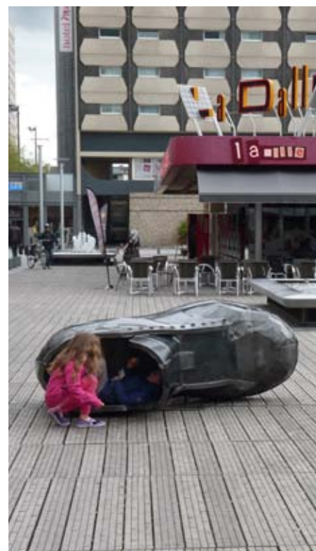
Delphine Lecamp, «San Francisco», 2013.

La galerie d'exposition est l'espace dédié à cette démarche. Avec six expositions par saison, elle accueille plus de 6000 visiteurs par an environ et 2000 scolaires.