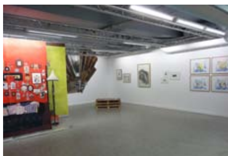
«Graphic», exposition collective, 2013.

Il développe une orientation majeure dans le domaine des arts plastiques et visuels qu'il s'attache à mettre en lien avec le territoire sur lequel il est implanté et une relation avec toutes les populations (ville, quartier, écoles, associations...).