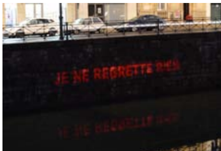
Vedran Perkov, «Je ne regrette rien», 2013.