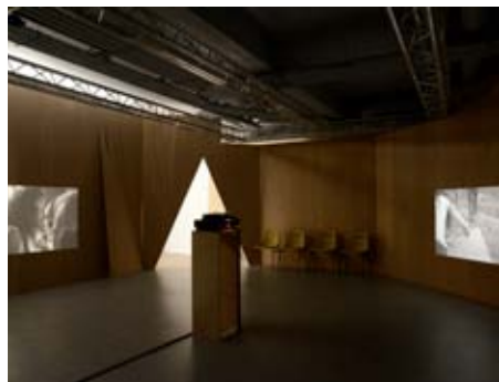
André Guedes, «Nova Argea» les Ateliers de Rennes Biennale d'art contemporain, 2012.

Le PHAKT - Centre Culturel Colombier développe un projet culturel urbain au croisement des oeuvres, des pratiques et de leur inscription dans l'espace culturel. Son projet artistique s'attache à la présentation des oeuvres, des soutiens à la création, en inscrivant ses actions dans des logiques de territoire, de socialité et de réseau (résidences, projets, éditions), en explorant des espaces contigus (le son, le corps) et en privilégiant les jeunes artistes. Ces projets engendrent des propositions d'ateliers, de conférences, de rencontres vers les populations et l'ensemble des publics pour permettre des cheminements de rencontre singuliers et pluriels.