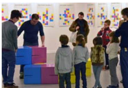
Julien Duporté, «Un ensemble de combinaisons discutables», 2013.

Pour ce faire, il propose aux publics une actualité à partir de trois polarités: - les œuvres et les artistes au travers des expositions et des résidences - l'apprentissage et les pratiques au travers des ateliers et des stages - la culture et l'histoire des formes au travers des cours et des conférences.