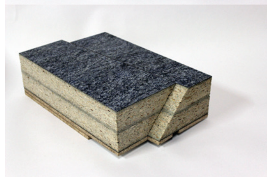
Faïlle extrait d'animation, François Feutrie, 2014