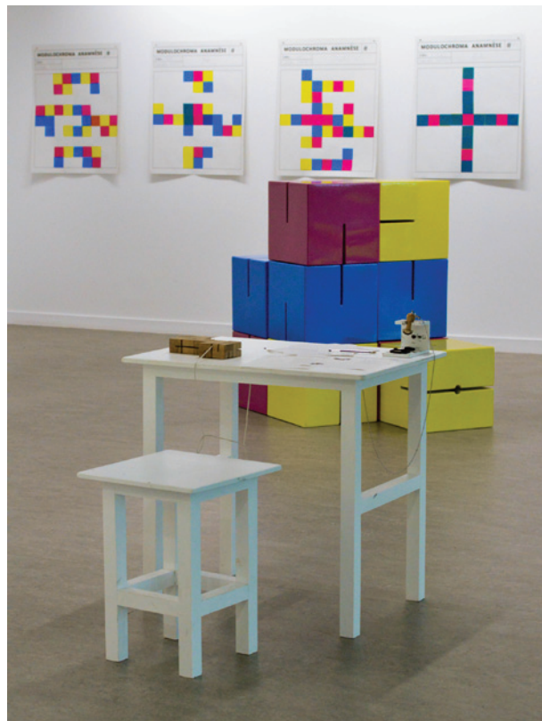
Julien Duporté, Un ensemble de combinaisons discutables, 2013.

La galerie d'exposition est l'espace dédié à cette démarche. Avec six expositions par saison, elle accueille plus de 6000 visiteurs par an environ et 2000 scolaires. Au sein des ateliers artistiques hebdomadaires, le Centre Culturel Colombier accueille plus de 600 adhérents dont plus de 200 dans les activités arts plastiques et photographie.