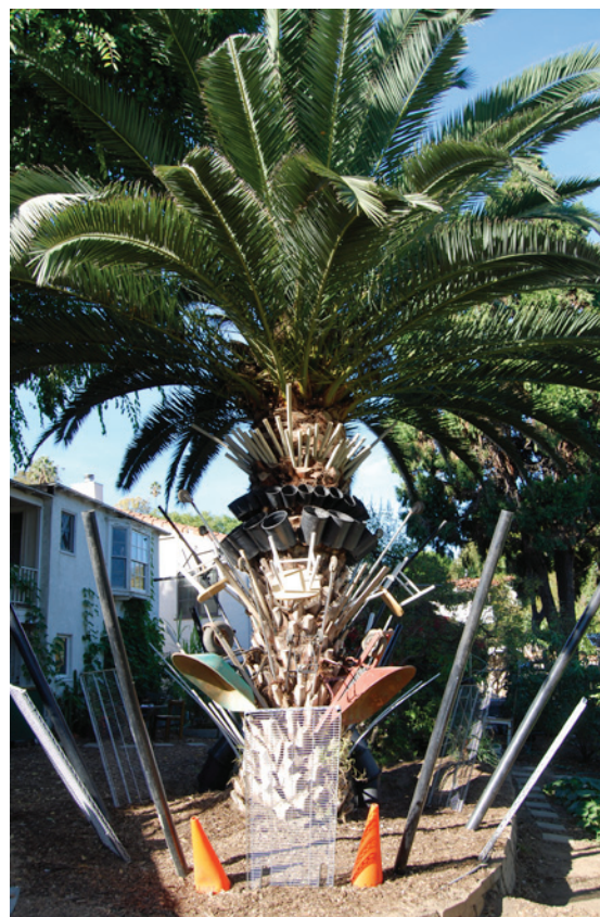
N°2. Holy palm tree «Cabanes & paysages ambulants en amériques» Los Angeles, Ca, États-Unis, 2010.