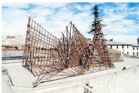
N°8 – Refugio urbano, «Cabanes & paysages ambulants en Amériques», Arequipa, Pérou, 2011.

Pour son exposition «Paysages d'intérieur» à Passerelle Centre d'art contemporain, Brest, François Feutrie s'est intéressé à la pratique classique de l'art topiaire. Il déplace les gabarits de cette taille contrainte des végétaux dans l'espace d'exposition, leur conférant un nouvel usage, construisant d'autres paysages. Sur les pas des grands paysagistes, l'artiste se livre à un jeu de composition, de nouveaux points de vue sur un paysage synthétique et standardisé où se mêlent formes, contre-formes et matières dans le centre d'art.