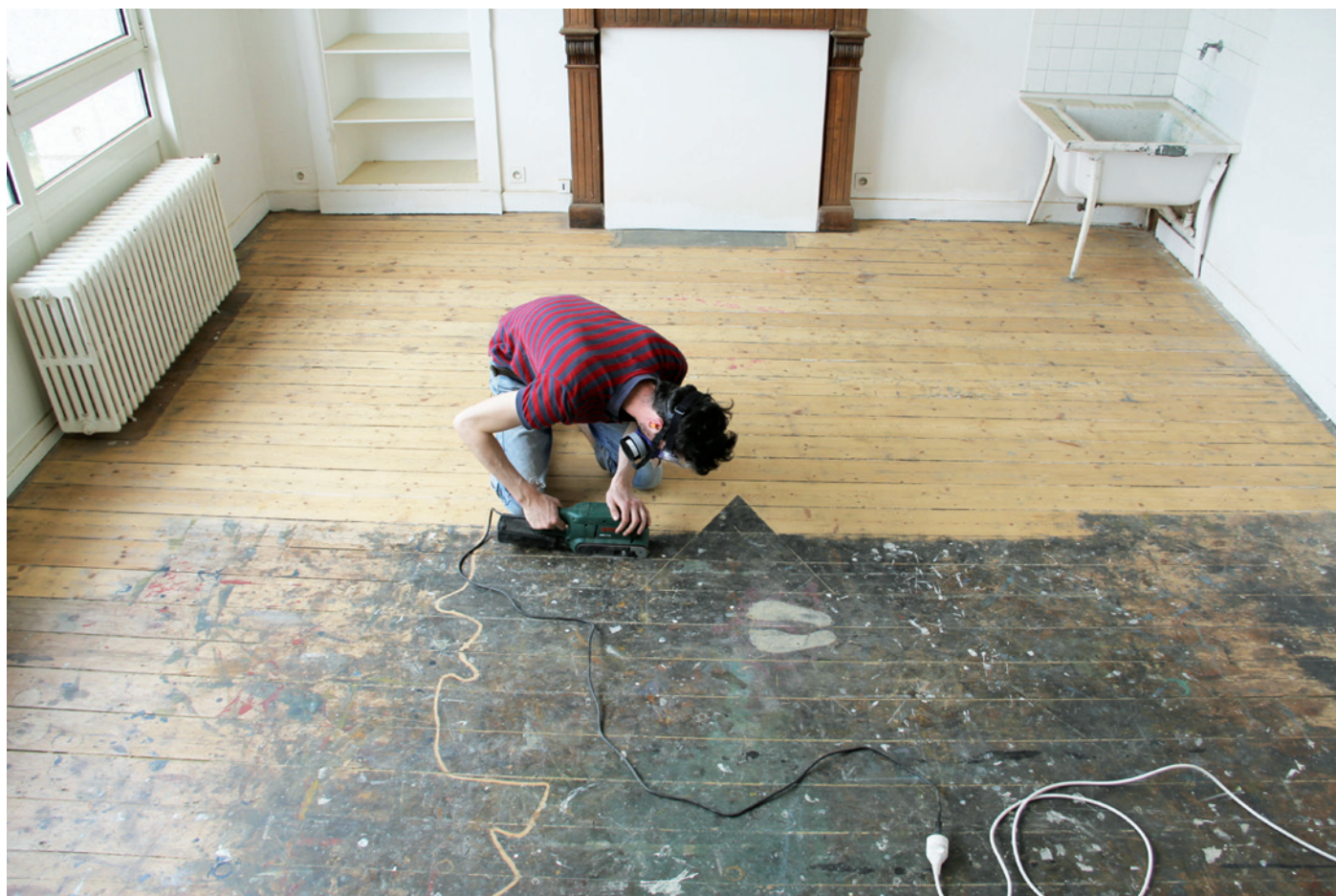
Ponçage préalable à la réalisation de Protubérance de parquet , Les Verrières - Pont-Aven, 2012.