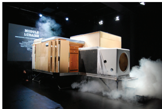
Module lunaire Espace culturel de l'université, Angers, 2011.

Depuis 2008 & 2009 - Fonds, galerie DMA, Rennes - Collection et fonds, galerie & artothèque Le Radar, Bayeux