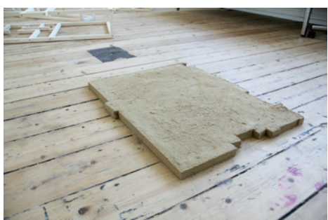
Protubérance de parquet, Pont-Aven, 2012.

Refugio Urbano (Abri urbain) a été construit sur le toit du Complejo Cultural Chávez de la Rosa, dans le centre-ville de la deuxième plus grande ville du Pérou, Arequipa. Cette installation propose une forme globale brute à géométrie complexe basée sur le triangle. Ceci pourrait rappeler généralement la forme des toits en France, alors que les matériaux et sa fonction sont ancrées dans le contexte. Entourée des architectures espagnoles réalisées entre le XVI e et le XVIII e siècle, l'installation s'impose dans le paysage.