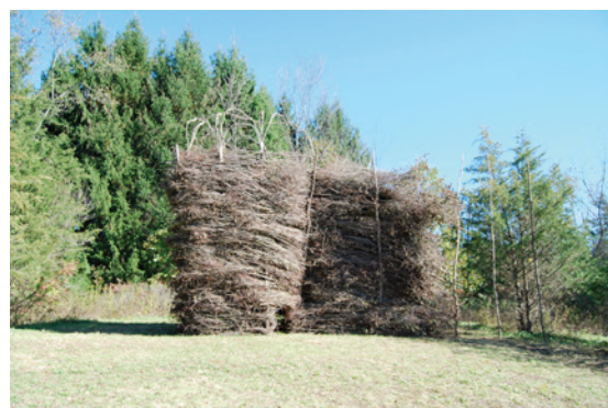
N°1. Winter house for cedars «Cabanes & paysages ambulants en amériques» Clinton Corners, NY, États-Unis, 2010.