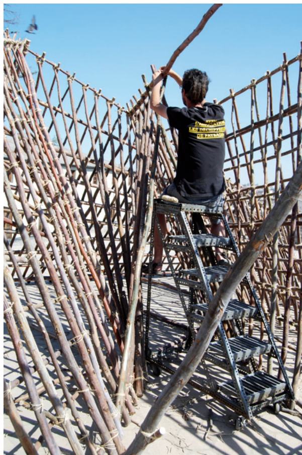
N°8 – Refugio urbano, en cours de construction, «Cabanes & paysages ambulants en Amériques», Arequipa, Pérou, 2011.

Quelques uns de ses travaux sont publiés dans le livre Système DIY . Ses projets ont été publiés entre autres dans la revue française de design graphique Étapes , dans le catalogue Mapping august - an infographic challenge et dans le livre Cabanes & paysages ambulants en Amériques .