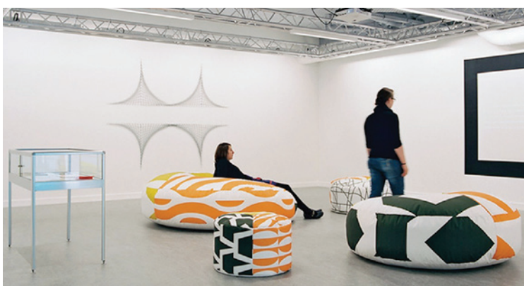
Johanna Fournier, Chère Sonia D., 2012.

Le PHAKT - Centre Culturel Colombier développe un projet culturel urbain au croisement des oeuvres, des pratiques et de leur inscription dans l'espace culturel. Son projet artistique s'attache à la présentation des oeuvres, des soutiens à la création, en inscrivant ses actions dans des logiques de territoire, de socialité et de réseau (résidences, projets, éditions), en explorant des espaces contigus (le son, le corps) et en privilégiant les jeunes artistes. Ces projets engendrent des propositions d'ateliers, de conférences, de rencontres vers les populations et l'ensemble des publics pour permettre des cheminements de rencontre singuliers et pluriels.