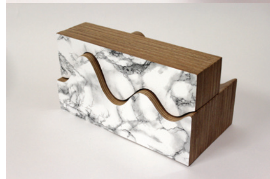
Faïlle extrait d'animation, François Feutrie, 2014