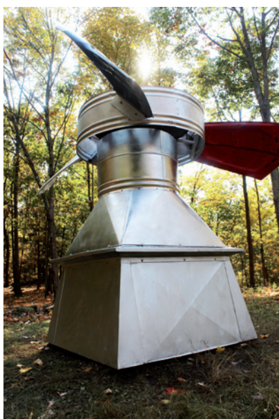
UFC, Unidentified Flying Cupola, Stanfordville, NY, États-Unis, 2012.

Constituée d'une concrétion de particules de peinture et de sciure de parquet et d'un plan poncé au sol, Protubérance de parquet rend hommage aux peintres venus en résidences dans cet atelier à Pont-Aven depuis 1883. La matière extraite de la surface du parquet est rassemblée en un volume posé à même le sol. La forme du volume épouse les contours architecturaux de l'atelier à une échelle réduite, et mime son plan.