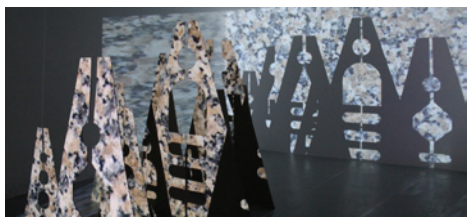
Le Fabricatoire de paysages, «Paysages d'intérieur», installation préparatoire, Passerelle Centre d'art contemporain, Brest, 2014

Pour son exposition «Paysages d'intérieur» à Passerelle Centre d'art contemporain, Brest, François Feutrie s'est intéressé à la pratique classique de l'art topiaire. Il déplace les gabarits de cette taille contrainte des végétaux dans l'espace d'exposition, leur conférant un nouvel usage, construisant d'autres paysages. Sur les pas des grands paysagistes, l'artiste se livre à un jeu de composition, de nouveaux points de vue sur un paysage synthétique et standardisé où se mêlent formes, contre-formes et matières dans le centre d'art.