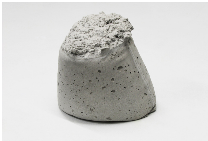
Pascal Jounier Trémelo, Étude II, Sac , 2013.