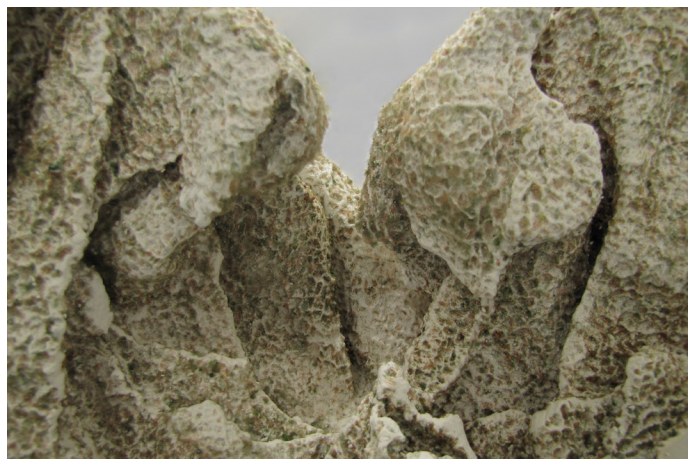
Pascal Jounier Trémelo, Panneggio bagnato, étude // 1 , 2014.