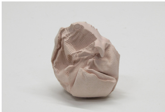
Pascal Jounier Trémelo, Étude, velours côtelé , 2013.