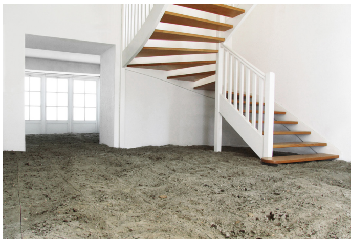
Pascal Jounier Trémelo, Prélèvement #05 , 2014.