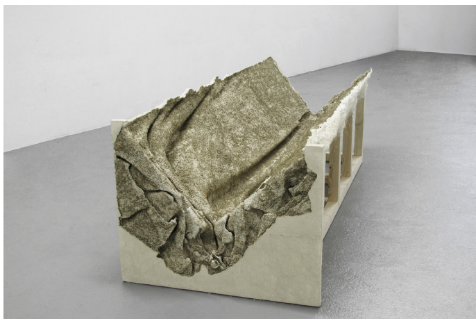
Pascal Jounier Trémelo, Panneggio bagnato, étude // 1 , 2014.