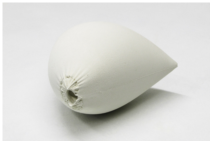
Pascal Jounier Trémelo, Épreuve 3/5, poche, Vert anglais , 2013.

* Le slump test (essai d'affaissement) est un test d'élasticité d'un béton ou d'un ciment, effectué sur un moule tronconique rempli de béton frais. On apprécie ainsi la consistance, donc l'ouvrabilité du béton.