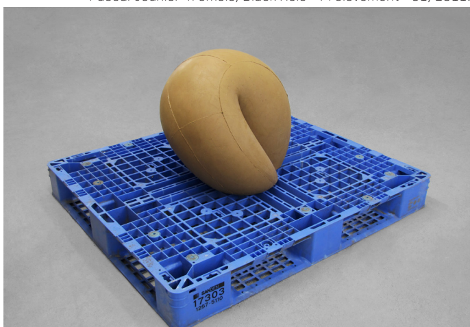
Pascal Jounier Trémelo, Chambre à air 3.50 x 84.00 x 8 TR 13 , 2013.