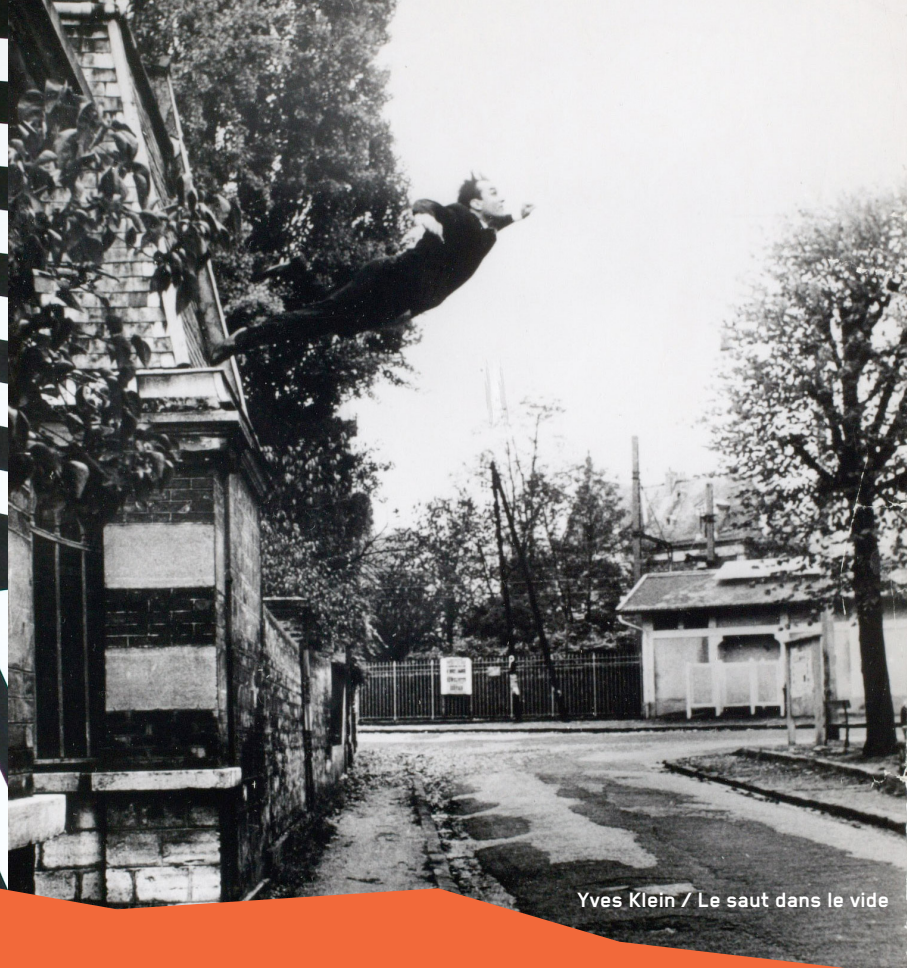
Yves Klein / Le saut dans le vide