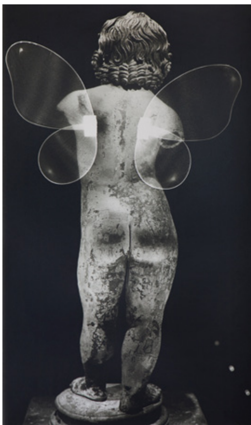
Vue d'exposition «Mur de rayogramme», Agde, 2017