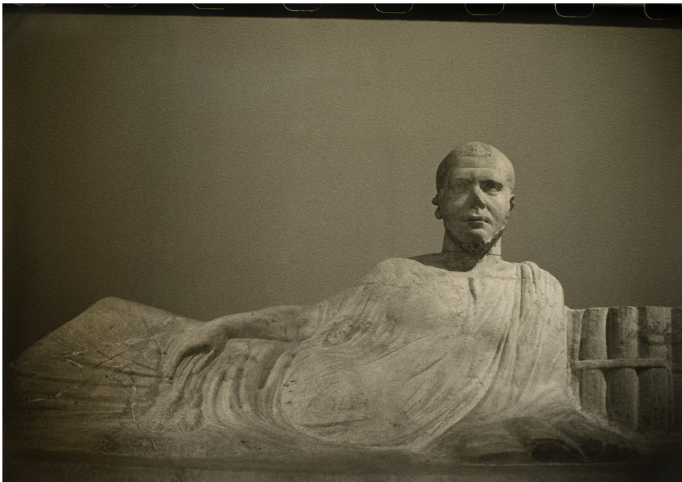
Gisant , 2016