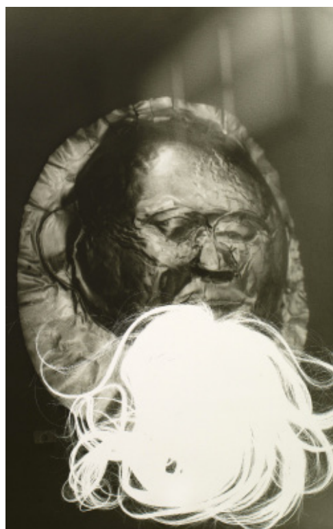
Mèche , 2017