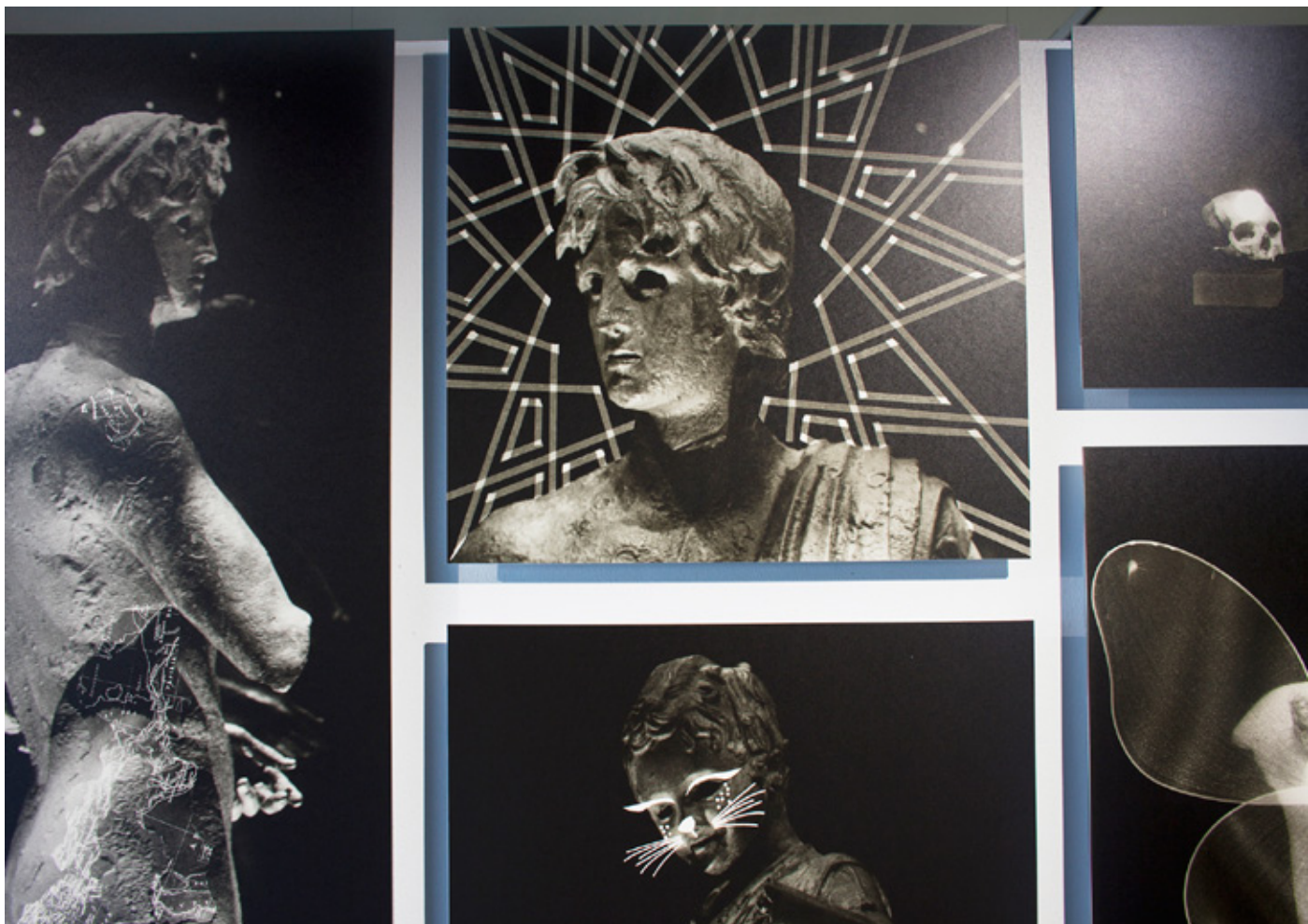
Vue d'exposition «Mur de rayogramme», Agde, 2017