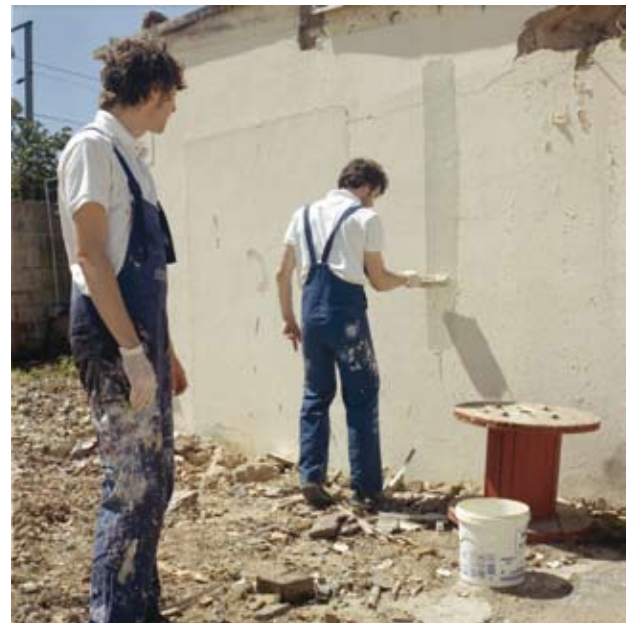
Les Frères Ripoulain