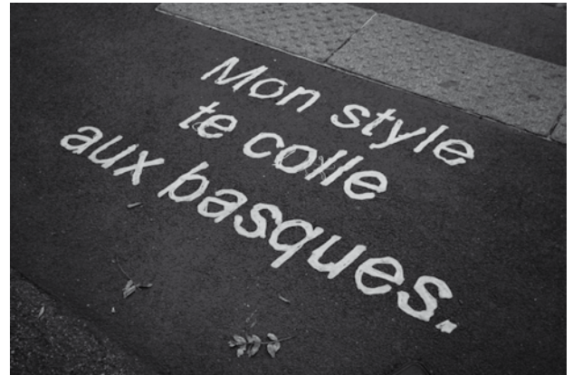
Mon style colle aux basques, Metz, 2009 © Mathieu Temblin