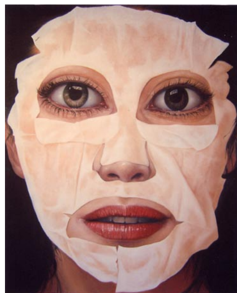
Masque, 2006 Huile sur toile, 165 x 200 cm