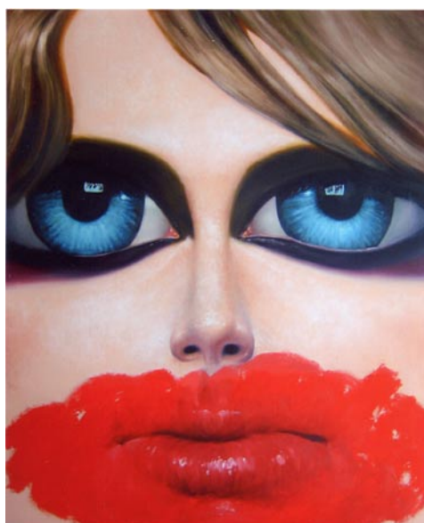
Rouge à lèvres, 2006 Huile sur toile, 131,5 x 161,5 cm