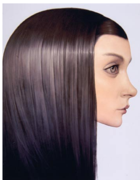
Profil, 2006 Huile sur toile, 165 x 200 cm