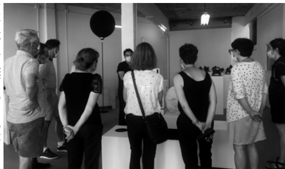
Les Ateliers du Regard, juin 2021, visite d'exposition, Socoflyme John Cornu/François Reynaud à la galerie Quinconce, juin 2021

Les ateliers du regard déambulent du contemporain vers l'histoire des arts et privilégient une approche sensible.