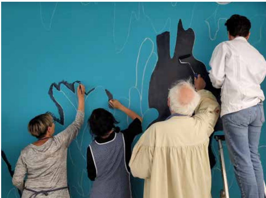
Les adhérents produisent la fresque murale de l'exposition

Du 1 er au 29 juillet 2023 20 rue du Dr Francis Joly Du mardi au samedi de 14h à 18h - Gratuit