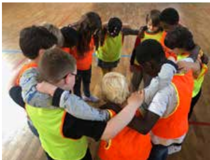
Un bel esprit d'équipe !

Résidence autonomie Le Colombier Allée Marcel Viaud Plus d'infos au 02.99.30.92.17