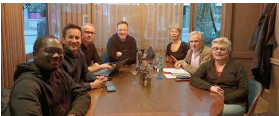
L'équipe des co-animateurs