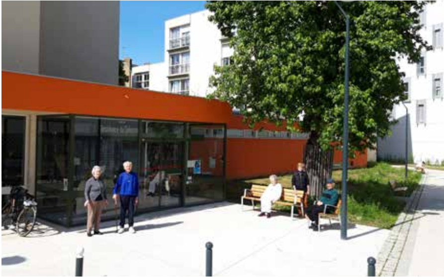
Devant les abords rénovés de la résidence